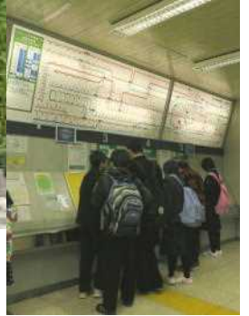
=まずは切符を買って=