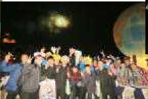
=買ったお土産を身につけてみんなで記念撮影=