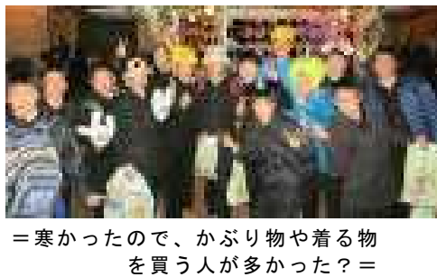
=寒かったので、かぶり物や着る物を買う人が多かった？=