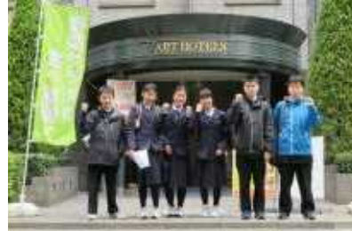
=自主研修、気合いを入れて出発=

2日目は都内自主研修でした。5班に分かれ池袋や原宿、お台場等有名な見学地を迷いながらも協力し合い無事まわり、研修することができました。その後、東京ドームでナイター観戦でした。応援用のジャイアンツのユニフォームが全員に渡され、それを着ての応援でした。オーロラビジョンに学校名や応援風景が映し出されたり、大盛り上がりでした。(初日・二日目を報告します。)