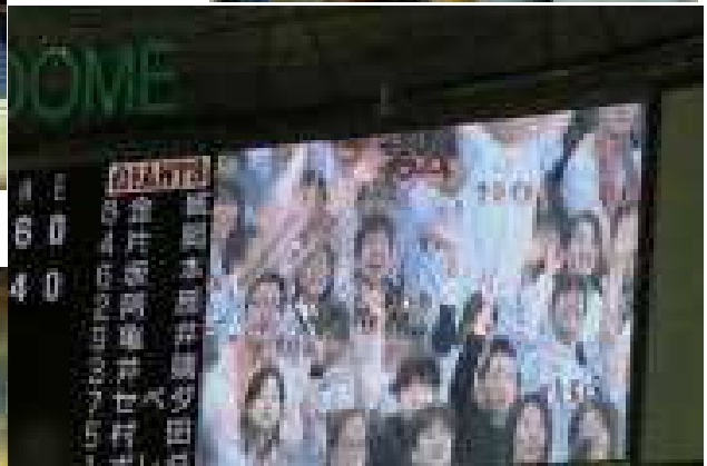
=東京ドームのオーロラビジョンに神代中の応援団が映し出され手を振って答えるみんな= ※試合は延長戦になり、遅くなったため途中でホテルに戻りました。