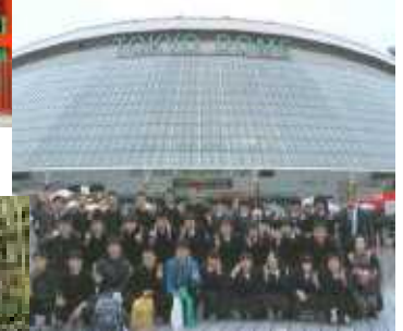
=東京ドームでパチリ=