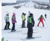
○滑って転んで みんな笑顔のスノーマン