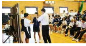
○神中祭準備集会にて サミーも張り切っているなあ