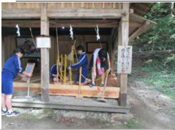
抱返神社を清掃する三年生

とと一完のMザ一頑成 し様う避 をスに「 思な人成Oさい年張し神まの予け神行ル則「学 いるのし・Kン生つ、中。ご定る中つ感っの校 ますこ頑まKのとて生祭。協でた祭て染ての す。と張しきテ、Fいま徒の力すめはいます症新 。をりたん！二・すはポを。、密す。大コ 期が。がマ年M。在夕願護夫・防口生活 待綺生融を生さ今準！い者し密止ナ様 し麗徒合三のんは備もいのて接対ウ式 たな一さ年Sのはを完 た皆行を策イ