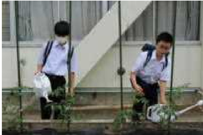
登校してすぐに水かけ

のかで自当マカ とけす主番トバー てる。的がへン年 も生トにあ水を生 良徒マ行るや背は いもトっのり負登 景いのてでをつ校 色ま苗いはしたす です。にるなままる 。話よくすまと 。朝しう、。ト、