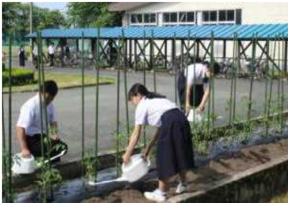
何回も往復する水やり

http://www.city.semboku.akita.jp/sc_jin chu/