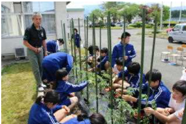
わき芽を取っています

かん係いしを私たを徒 にとたま科 つがでまた知自り取もトつミしの今 た、写しがり身しつまいニた授日 で挙真た、まもまたまとてト。業の す手を。生し誘しりしがのマ自が二 。し掲ス徒た引た、た苦授ト分、時 て載ペは。と。誘が手業のた外間 発で！頑暑い見学引、と。誘が手業のた外間 表きス張いうをわいた。作植わ技 もまのっ中言て行きう。業えれ術 良せ関てで葉、つ芽生 業えれ術