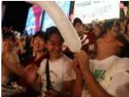
ジェット風船あげました！