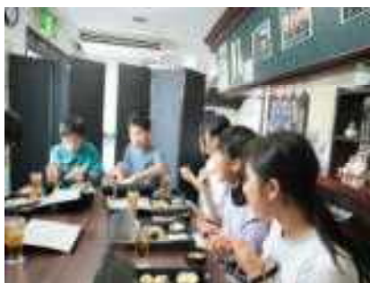
フカヒレスープも美味しい