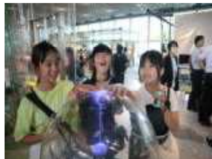
科学館でビリビリ？ 女子だけで乗ってみまーす