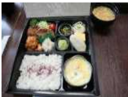
牛タンハンバーグなどの昼食