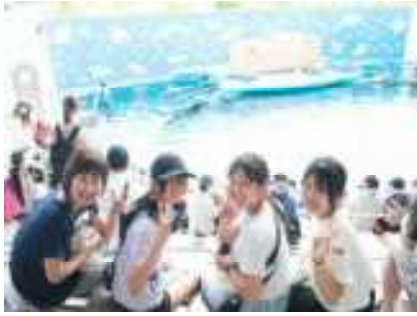
もうすぐイルカショー