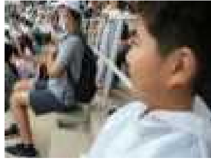
イルカに水かけられるかなあ