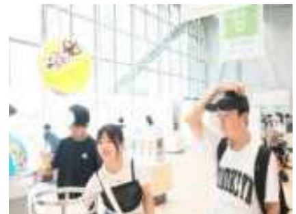
科学をいろいろ体験 ベニーランド最高！