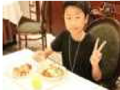
豪華バイキング朝食