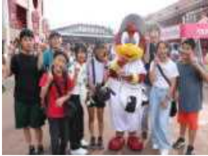
楽天のマスコット「クラッチ」と