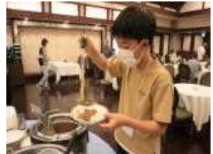
大盛り？牛タンカレー