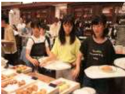
スイーツいっぱい！！ 今は余裕のジェットコースター