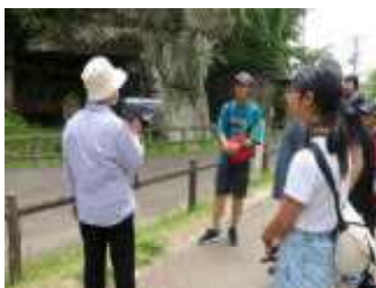
国宝瑞巖寺境内の見学