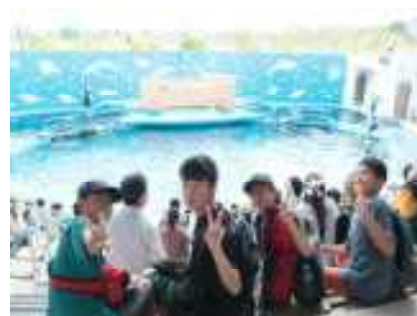
まもなくイルカショー