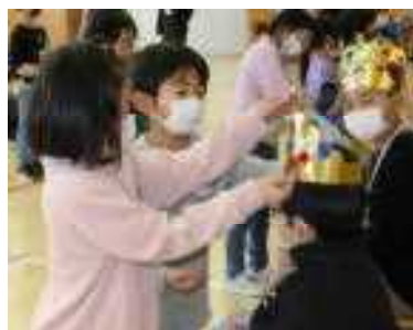
みんなのヒーロー、6年生へ

お互いをよく知るひのきっ子たちですから、メッセージの一つ一つにぬくもりを感じます。