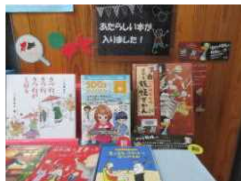
↑ 夏休み明けの本の紹介コーナーです。新刊が2冊入りしました。

朝夕の涼しさが秋の訪れを感じさせます。今年は残暑という言葉はあまり使うことがないようです。ならば、「読書の秋」をさらに楽しめるようにしたいと思います。