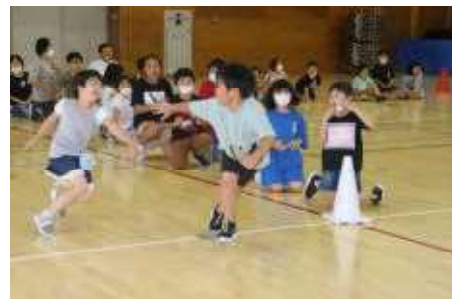
↑ 7月のお楽しみ会でのリレー

今年こそはと準備や打ち合わせを重ねていた「地域大運動会」ですが、新型コロナウイルス感染症拡大のため、中止せざるを得ませんでした。とても残念です。また、校内で行うミニ運動会も実施はできませんでした。子どもたちもちろん残念がっていますが、準備を進めていたひのき清流会や地域の方々もこのような事態に悔しさと寂しさを感じていることだと思います。