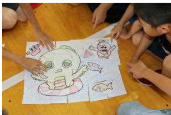
ピースを合わせるとこんな絵の パズルが完成