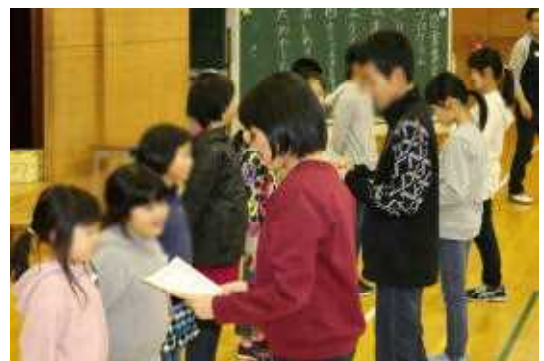
たくさん本を読んだ人の表彰

本の読み聞かせでは、みんな前の方に集まって真剣に聞いていました。クイズは、縦割り班で協力して答を考えました。読んだことのない本から出された問題もあり、手を挙げて多数決で決めている班もありました。その後、たくさん本を借りた人を紹介しました。最後はしおりのプレゼント。このしおりは評判がよく、みんな毎日の読書の時に使っています。