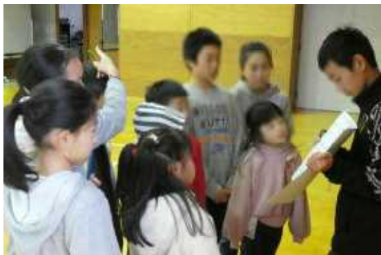
クイズは難問もありました