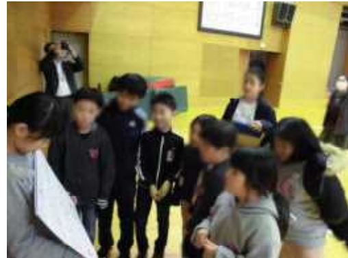
縦割り班でクイズの答えを考えます