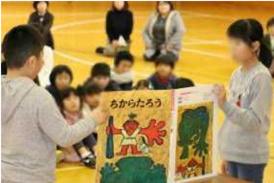
『ちからたろう』の読み聞かせ

11月28日(水)、今年も図書委員会のみなさんが『図書集会』を開いてくれました。