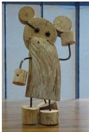
こんなすてきな作品ができました