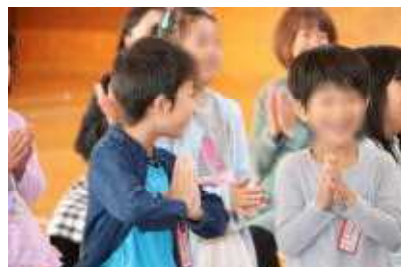
友達が安全に渡れたときはほっとしたようです。