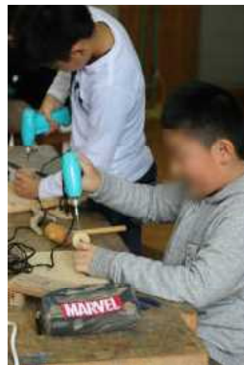
ドリルも上手に使って