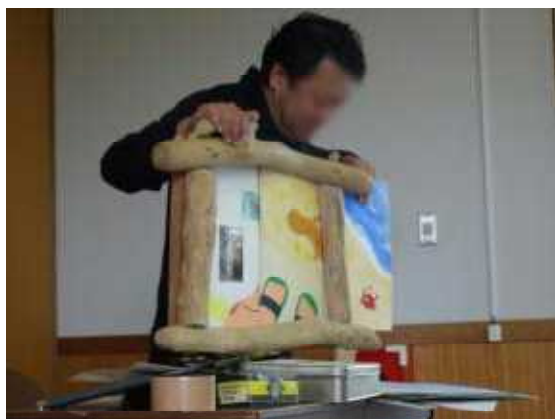
紙芝居で自己紹介をしてくれました