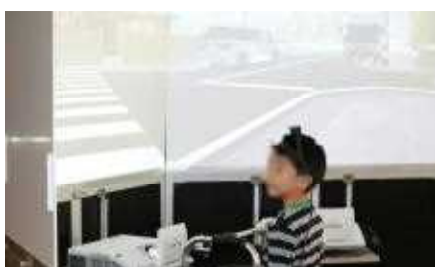
トラックが止まって見えにくい場所でも落ち着いて確認できました。