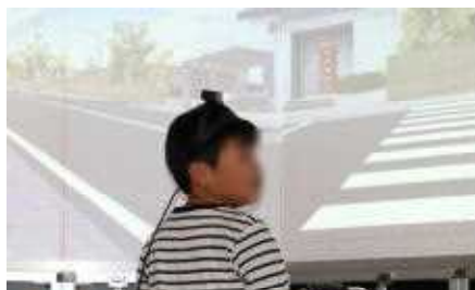
他の人が渡っても自分が安全だと思うまで渡りませんでした。

代表の児童は全員無事に渡ることができましたが、ちょっと危なかった場面や、もっと気をつけた方がいいポイントなどを、コンピュータが教えてくれました。時間の都合で全員が体験できませんでしたが、友達の挑戦を見ていて手に汗をかいた、という人もいました。特に105号線は、大きな車も通りますし、スピードを出して走る車も多いようです。しっかり安全確認をすることを忘れずに、自分の命を守れるようにしたいものです。