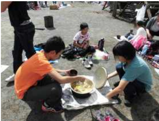
おいしそうにできました