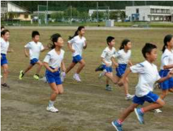
ピストルの合図で一斉にスタート

マラソンは、グラウンドと校舎周りを組み合わせ、低学年が約700m、中学年が約1,100m、高学年が約1,500mの距離を走りました。練習の成果を十分発揮できたようで、新記録がたくさん生まれました。他の学年の力走を応援する姿は、『心豊か』な姿でした。そして何より全員が完走できたことが素晴らしかったと思います。『はつらつと』したみんなの笑顔が光りました。