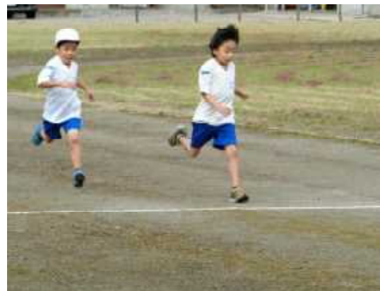
デッドヒートも繰り広げられました