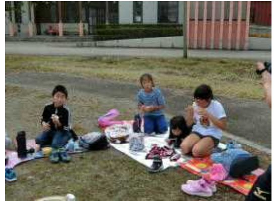
おいしい おいしい