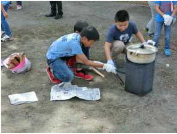
火おこしは任せて！