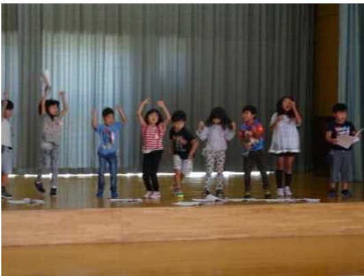
1年生は何をやるのかな？