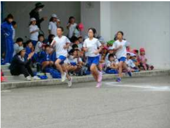
こども園のみなさんの応援も力になりました