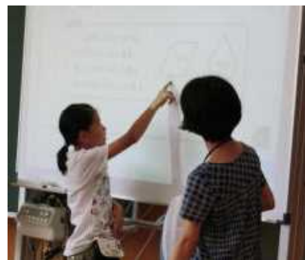
4年生 ～ 算数