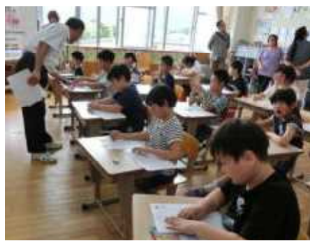
2・3年生 ～ 学活