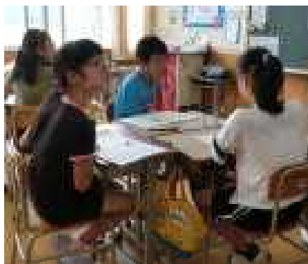
6年生 ～ 国語