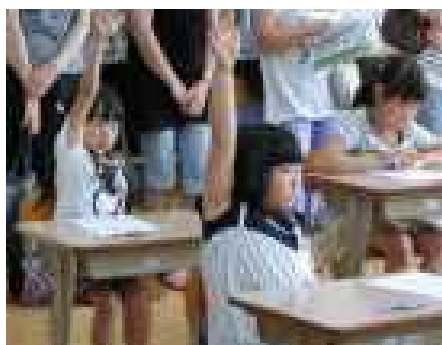
1年生 ～ 算数