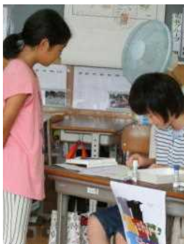
5年生 ～ 外国語活動

夏休みを前に、子どもたちは「夏休みの計画」を作成しています。学校では例年以上に、睡眠時間や電子メディア使用の時間について考えさせながら、計画を立てさせております。ご家庭でも、子どもさんの立てた計画を見て、協力してあげてください。