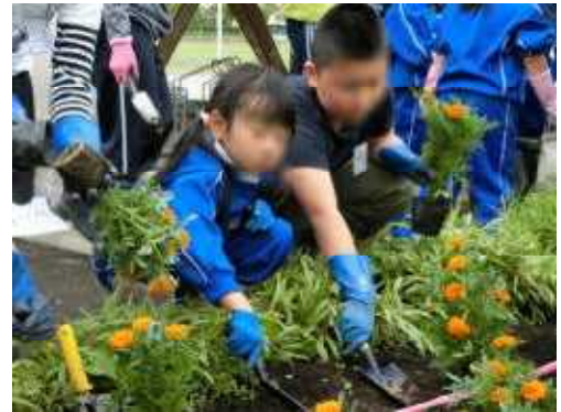
黄色とオレンジ色のマリーゴールドを植えました。

花を植えている時に、上級生が下級生に手伝ったり、進んで後片付けをする人がいました。こんな気持ちや行動が『人権運動』のスタートですね。