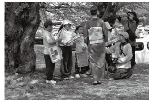
説明することだけにとらわれず、迎える気持ちを大切にしている様子が伺えました。

角館小4年生の伝統的実践となつていく「さくらの町案内人」が4月末に行われました。さくらの町は葉桜になつていきましたが、地域からのサポーター13人の協力をもらい、準備万端の4年生は10グループに分かれて、意気揚々と松木内川堤・武家屋敷通りへと出かけました。その道すがら、お年寄りとお年寄りが多いため、はつきりと大きな声で挨拶しようね。でも、叫ぶのは違つた。驚かせちゃ駄目だものと同じ班のメンバーに話しています。いつも挨拶を大切にしていることが伝わってきました。それぞれのグループが「お時間、いいですか」と、全員笑顔で話しかけます。桜・榊細工・お祭・ささら・武家屋敷・お