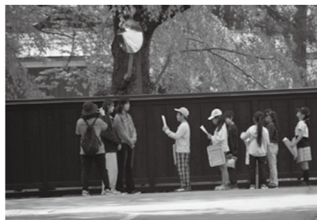
「さくらの町案内人」のめあては「自分たちの町のよさを観光客に発信しよう～進んで・笑顔で・分かりやすく～」です。

角館小4年生の伝統的実践となつていく「さくらの町案内人」が4月末に行われました。さくらの町は葉桜になつていきましたが、地域からのサポーター13人の協力をもらい、準備万端の4年生は10グループに分かれて、意気揚々と松木内川堤・武家屋敷通りへと出かけました。その道すがら、お年寄りとお年寄りが多いため、はつきりと大きな声で挨拶しようね。でも、叫ぶのは違つた。驚かせちゃ駄目だものと同じ班のメンバーに話しています。いつも挨拶を大切にしていることが伝わってきました。それぞれのグループが「お時間、いいですか」と、全員笑顔で話しかけます。桜・榊細工・お祭・ささら・武家屋敷・お