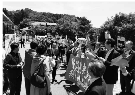
仙北市に訪じた台湾関係団体をお出迎えている様子