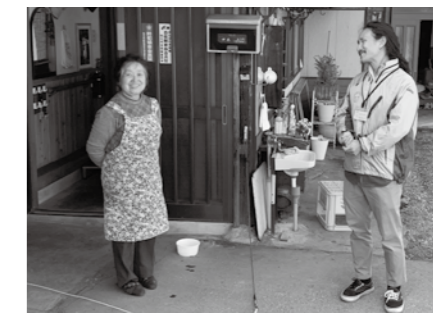
教育旅行受入れ家庭への訪問の様子