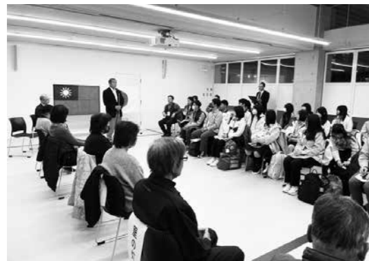
台湾学生と宿泊先農家民宿との対面式の様子