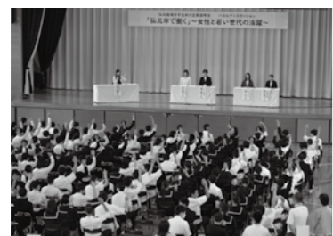
習資料「仙北市 夢百科事典」を呈送しています。 ※部数に限りがあります。進呈はなくなり次第終了します。

働くことについて パネルディスカッション開催 児童・生徒のふるさとを思う志を育む YAMME・サクラマスプロジェクトでは、働くことについて考えるパネルディスカッションを開催しています。昨年度に続いて、2回目の開催です。 今年度のテーマは「仙北市でつくる。つたえる。郷土への夢・志を元気のもととして」です。仙北市で、何をつくり、どのようにつたえていくか、形のあるもの、目には見えないもの、つくり上げたものの、達成したい夢、内容は多彩です。 昨年度参加者からは「さまざまな職種の方々の話を聞いて中学生のうちに何をしておくべきかのアドバイスをもらったのが良かった」「勉強や部活を頑張ることも大切だとわかった。将来は自分がやりがいのある職業につきたいと思った」などの感想が寄せられました。市民の皆さまの参加をお待ちしています。 なお、参加くださった方には、パネルリストの思いを詳しく掲載したキャリア学習資料「仙北市 夢百科事典」を呈送しています。