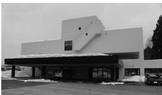
※ 2月24日より開庁した角館上野庁舎

▼小学校統合関係事業費 1,609万9千円 小学校統合を進めるため、統合関係校による統合準備委員会を設置し、統合に必要な協議を行う。