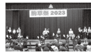
地域の方々と一緒に生保内節を披露