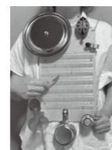
手作りする楽器の見本です