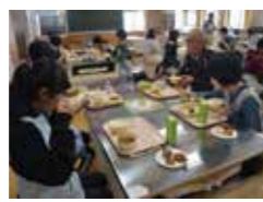
校長先生との楽しい会食テーブルもあります。

この日の西明寺小学校の通常献立は、ごはん・さしみフライ・カレーソテー・もずくのすまし汁・牛乳。6年生には牛乳ではなくセレクトドリンク（カフェオレ・りんごジュース・緑茶から選択）がつけました。デザートにはセレクトミニケーキ（レアチーズ・シヨコラ・練乳イチゴから選択）、さらにスペシャルメニューのフライドチキン・たこ焼きが並びます。