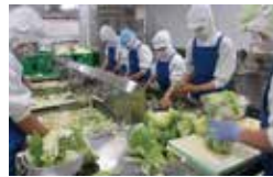
総合給食センターでは細心の注意を払い、各校に安全・安心を届けています。

スペシャル給食 西明寺小学校 学校給食はただのお昼ご飯の時間ではありません。「学校給食法」で定められた「適切な栄養の摂取、健康の保持増進、食事についての正しい理解、健全な食生活を営む判断力、望ましい食習慣、明るい社交性、協同の精神、自然の恩恵の理解、生命・自然を尊重する精神、環境保全、食にかかわる人々の活動の理解、勤労を重んずる態度、地域の優れた伝統的な食文化についての理解、食料の生産・流通・消費についての正しい理解」を養うことを目標とする大切な学びの時間です。仙北市では、市内3か所にあった給食センターを令和2年度に統合し、仙北市総合給食センターとして「家庭と共に歩む学校給食」地域と結び学校給食「思い出に残る学校給食」を推進しています。スペシャル給食は学校生活の楽しい思い出の一コマとして友だちとの食事を楽しみ、学年・学級で食を通して親睦を深めることができるよう、各校の最学年を対象に実施しているものです。