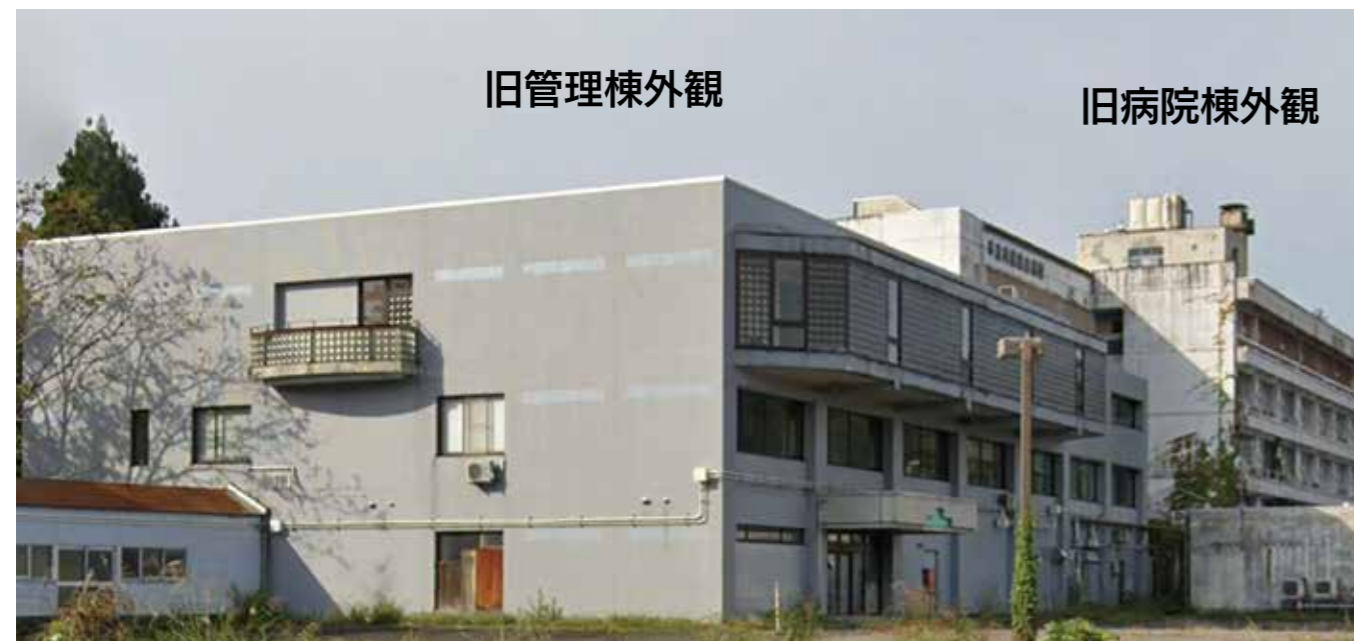
中央が改修予定の管理棟で、右奥が解体予定の病院棟となります。