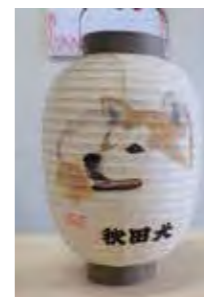
作品のイメージです