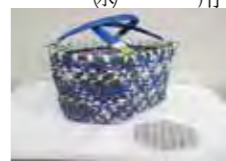
作品のイメージです