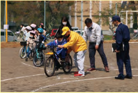
自転車の正しい乗り方を教わりました。大人に支えてもらいながら、正しい乗り方を練習しました。