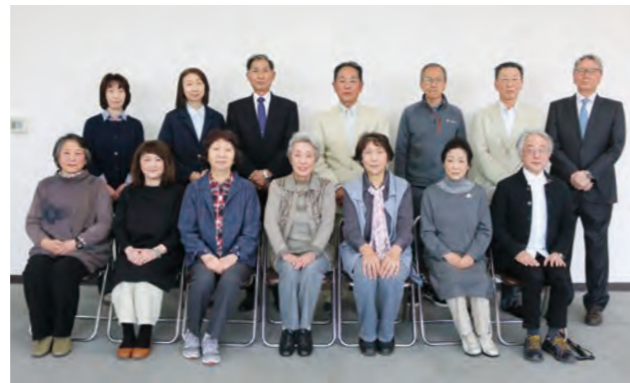
2年間生涯学習奨励員として頑張ります。

生涯学習奨励員は、地域住民の学習活動を奨励・支援し、生涯学習を活性化するために委嘱されています。 奨励員は、各々の得意分野でサークル活動や公民館活動を通じ活躍しています。やってみたいことや体験してみたいことなどがありましたら、奨励員や公民館、生涯学習課にご相談ください。