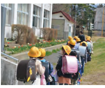
黄色い帽子をかぶり 下校指導を受ける新入学児童たち

角館町有志による「角館紅ザクラ」の会が角館小、白岩小、角館中の三校に角館紅ザクラの苗木を寄贈、児童生徒と一緒に