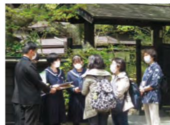
推進員と生徒の皆さん

新年度の協働活動が始まるにあたり、角館中学校地域学校協働本部の推進員と今年度の活動の進め方について4月17日に打合せが行われました。同じく20日・21日には、角館の桜を目当てに訪れた観光客へ「桜の案内人」の活動が行われ、推進員の方々が見守るなか地域が誇る桜や武家屋敷を同校3年生がPRしました。案内を受けた観光客からは後日、学校へ感謝のメールが届き「桜の案内人」の取り組みは訪れた人の心に花を咲かせることができたと好評です。 短い期間での準備となり当日はドキドキしながらの活動となりましたが、生徒たちにとって人との出会いやおもてなしの心のすばらしさを感じられる貴重な体験になったと思います。