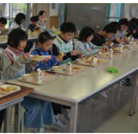
縦割り給食でみんなで楽しく食べる児童たち

に植樹しました。角館小学校では全校児童三五三人を代表して五人の六年生が、学校前庭花壇に植樹