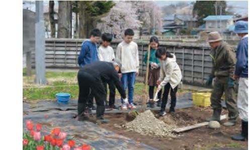
会員の指導を受けながら植樹する児童たち

角館町有志による「角館紅ザクラ」の会が角館小、白岩小、角館中の三校に角館紅ザクラの苗木を寄贈、児童生徒と一緒に