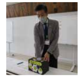
厳正なる抽選の結果、89名の方に景品が当選し、発送しています。