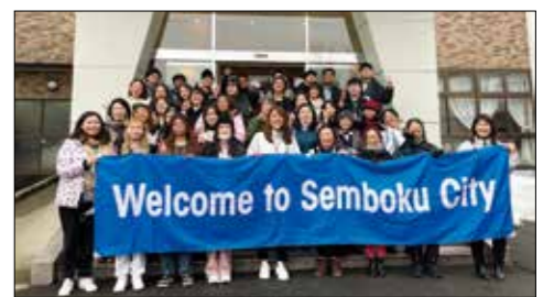
↑ 2月に JENESYS シンガポール訪日団を受け入れた様子