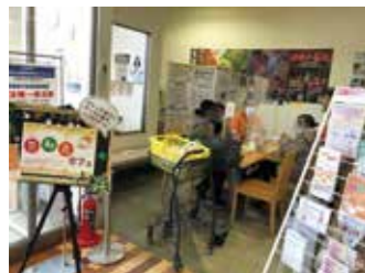
R4年度ワンダーモールでの様子