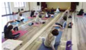
昨年開催した「ヨガ教室」

ヨガの基本を学び、 健康な心と体を作り ませんか。初めての 方も無理なく楽しく 受講できます。ぜひ ご参加ください。