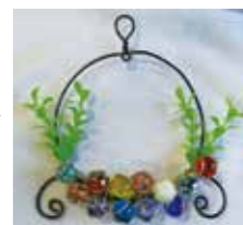
ビー玉の色彩と 光のハーモニー

これまでの基本理念である「歴史と文 化を尊び、ふるさとを愛し誇れる人づく りを目指した社会教育」と「同じ時代を 生きるものとして、他を思いやる心を養 う生涯学習」を引き継ぎ市民一人ひとりの 生涯学習活動を支援します。また、公 民館活動については、アフターコロナの 課題が今後も続くこと予想されることか ら、必要な対策を講じながら「いつでも・ どこでも・だれでも・なんでも」学ぶこと ができる学習機会と情報の提供に努め、 幅広い世代に親しまれる公民館になるよ う取り組みますので、市民の皆さまにも 生涯学習に関するご意見・ご要望などが ありましたら、お近くの公民館へお聞か せくださるようお願いいたします。