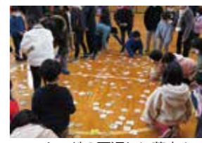
カードの面返しに夢中!