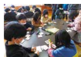
楽しかったカード作り

1月12日、神代小学校で生涯学習奨励員による「大人と子どもの生涯学習サポートDAY」が開催され、同校のポプラ児童クラブ約40人と「仲間とリバーシ」というカードゲームで交流しました。 このゲームは、カードの表面と裏面に分かれたチームが、床に並べたカードを互いにひっくり返し合いながら最後に面数の多いチームが勝ちとなる遊びです。 会場の体育館では、奨励員と一緒に作ったカードが広げられ、進行役が出す「お題」がルールとなり、子どもたちが