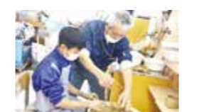
10月25日、白岩小6年生が白岩畑にチャレンジ。思い出に残る収穫ができました。

一年を振り返り、今年度の地域学校協働活動を振り返ると、子どもたちは地域の人の「こと」とに関わり、未来の地域の担い手としての自覚を持つきっかけとなり得る場面がたくさん見られました。 畑作り・引渡訓練・くりっこ探検隊・景観学習・講演会・協働活動推進員の活動など、様々な取組や地域の伝統にふれる活動も数多く行われ、今まで知らなかった地域のよさと出会うことができました。また、地域の皆さんにも、子どもたちと関わることを楽しみ、やり甲斐を感じてもらいながら、目標とする「元気な地域づくり」に向け着実な広