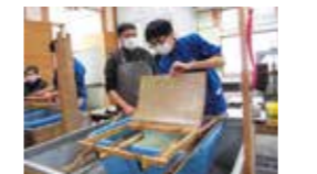
12月16日、西明寺中3年生が卒業証書用の「鎌足和紙」を丹精込めて紙漉きをしました。

がりが感じられた一年となりました。来年度からは、小・中学校への「コミュニケーション・スクール(学校運営協議会)」導入に向けた計画が本格的に動き始めます。学校の思いと地域の願いを共有し、地域ぐるみで子どもたちを育む「地域」ともにある学校づくりを目指して、今後も地域の皆さんのお力添えをどうぞよろしくお願い致します。