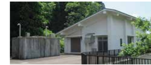
↑西明寺低区第2浄水場（平成26年建設）

水道事業は、平成29年3月に上下水道2事業、簡易水道13事業を廃止し、新たに仙北市水道事業として【統合創設】されています。本市の水道は、角館地区が昭和30年代、田沢湖地区と西木地区は昭和40年代に始まり、昭和40、50年代に建設された施設が多く存在しています。 そのため、施設・管路の多くが老朽化や更新時期を迎え、補修費や更新費用が必要になるなど、大幅な経費の増加が見込まれています。 また、人口減少、節水機器の普及などにより水道使用量、料金収入が減少傾向にあり、平成30年度から令和3年度まで4期連続の赤字決算となり、厳しい経営状況が続いています。