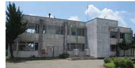
↑角館浄水場（昭和51年建設）

令和4年12月16日号の広報でお伝えしているとおり、市の上下水道事業は、料金の増額改定が避けられない状況です。これから3回にわたり、上下水道事業の役割としくみを説明し、直面する課題と料金改定の背景をお伝えしていきます。