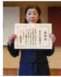
厚生労働大臣表彰を受賞した(株)安藤醸造。