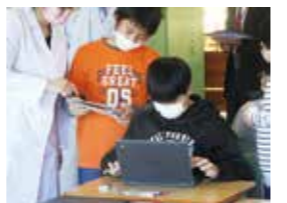
ICTを活用した授業の様子。

に向けて話す、体を向けて聞く、反応しながら聞く、みんなの発言がつながるように話す」ことを重視してきました。また授業の中に「かわり合って、しっかりと、わかりあうための話し合いの時間(かわりの時間)」を設定し、その充実に向けて研修を進めてきました。5年生の理科の授業では、相手と意思疎通できるように話し・聞く習慣が身につけている子どもたちの姿が印象的でした。