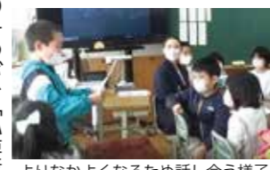
よりなかよくなるため話し合う様子。

角館小学校は子どもたちが、「自分の考えと他者の考えを比較しながら、学びを深められるようになること」「話し合いのよさや楽しさを感じられること」を重視しています。その一つが、「必要感のある話し合い」です。2年竹組の特別活動の話題は、「みんながもっとよくなるためのイベントを計画しよう」でした。司会、協議、すり合わせなど、すべて子どもたちの手で進められ、子どもたちの育ちを感じました。4年竹組の社会の授業では、水害とその対策について、ICTを活用した話し合いがされました。学びを通じて子どもたちは、災害から暮らしを守るために誰が何を行っているのかも知りたいたい思いを強くしていました。どちらの授業も課題を自分のことと捉え、積極的に発言する子どもの姿が見られました。