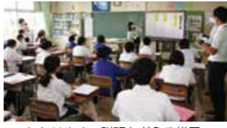
わかりやすい説明を考える様子。

角館中学校は、「自己決定した目標に向け、見通しをもって計画的に粘り強く行動する生徒」、「他者の立場や考え方の違いを理解し尊重する生徒」、「新たな価値の創造に向け、言語や技能を使いこなす生徒」の育成を目指して研究を進めてきました。1年C組の国語の授業は、「自分の推し」をPRするために、説明文の書き方を工夫する」ということがテーマでした。友だちの作品を読んで互いにアドバイスし合い、それをもとにして自分の文章を推敲しました。友だちのアドバイスを受けた時に、「なるほど」、「気づけばもっと伝わるかもしれない」と考え、再考している子どもたちの姿が印象的でした。