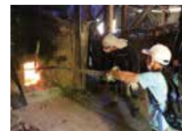
炭焼きの熱気を体感!