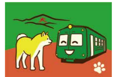
秋田犬と青ガエル

秋田内陸地域公共交通連携協議会では、沿線にひまわり迷路を制作します。内陸線の車窓から鮮やかな黄色で彩られた風景や列車から降りて全長約800メートルのひまわりの大迷路を冒険して、この夏の特別な思い出の「コマ」にしてはいかがでしょうか。 ぜひ、田んぼアートとともに内陸線に乗ってお楽しみください。