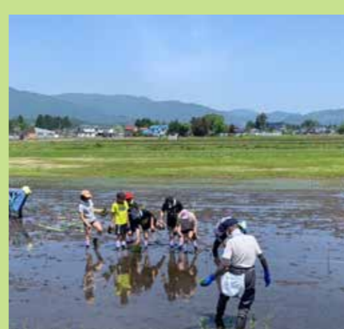
東前郷会場 田植えの様子