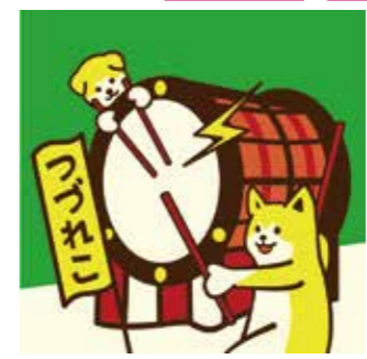
秋田犬と綴子大太鼓