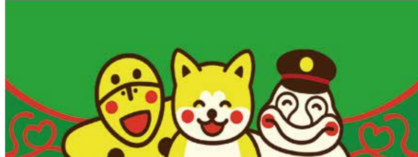
秋田犬といせどうくんと笑う岩偶