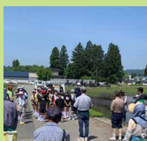
東前郷会場 神代小学校6年生の生徒たち