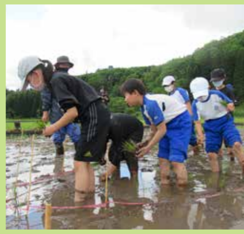
上桧木内会場 西明寺小学校4年生 田植えの様子

秋田内陸線田んぼアートの田植えの様子をご紹介します! 今年で11年目となった内陸線の風物詩「田んぼアート」の田植え作業が5月30日は東前郷、6月1日は上桧木内駅向かいの会場で行われました。「田植えは初めて」という地元の小学生が3年ぶりに参加し、地域の方から植え方を教わりながら、泥まみれになり作業をしました。上桧木内地区では秋田県内に支店を置く企業の皆さまにもご参加いただき、今後のでき映えを情報発信していただく予定です。 今年のデザインは「秋田犬とのコラボ」がテーマで、沿線5か所で開催しており、6月下旬から見頃を迎えています。