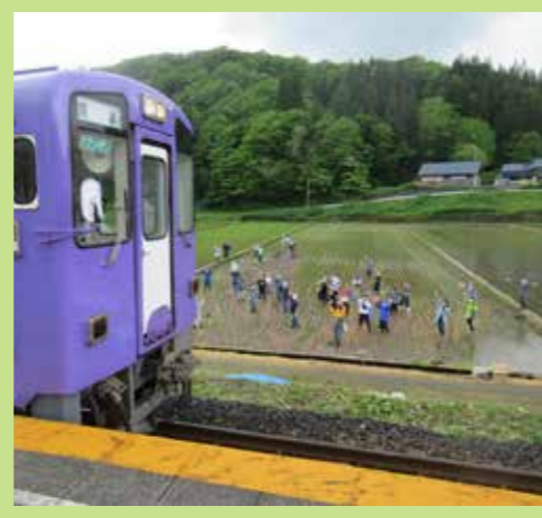
上桧木内会場 内陸線に手を振っておもてなし