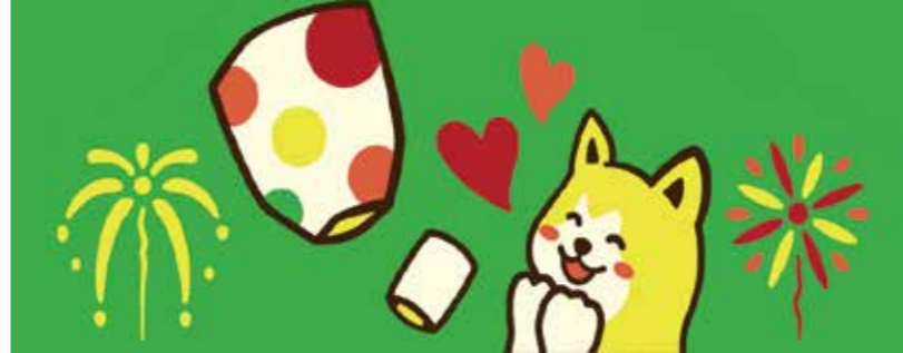
秋田犬と上桧木内の紙風船上げ