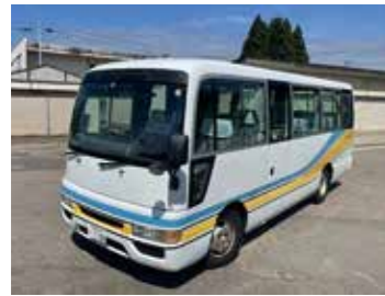
ニッサンキャブオーバー