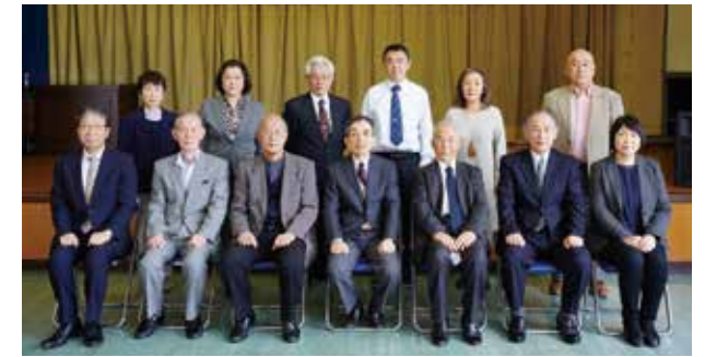
2年間社会教育委員として頑張ります。