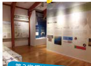
第3室 環境再生への道