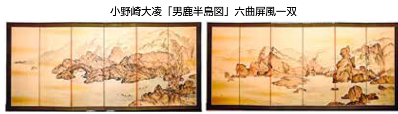
小野崎大凌「男鹿半島図」六曲屏風一雙