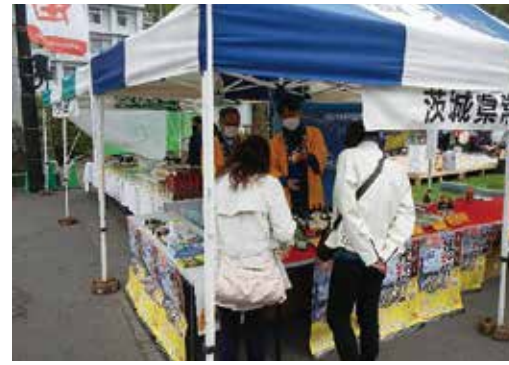
お目あての商品を買い求めるお客さん。

角館の桜まつり期間中、仙北市の姉妹都市・連携交流都市（長崎県大村市、茨城県常陸太田市、秋田市）の物産展が4月29日、30日と旧角館庁舎前の特設テントで開催されました。大村市名物のちゃんぽん、皿うどん、カステラや常陸太田市名物のそばや菓子類、秋田市からはいぶりがっこなど、地元でしか手に入らない品々が並びお客さんで賑わいを見せました。