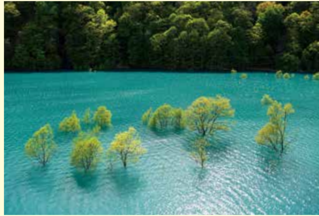
新玉川大橋から見える光景はとても幻想的です。