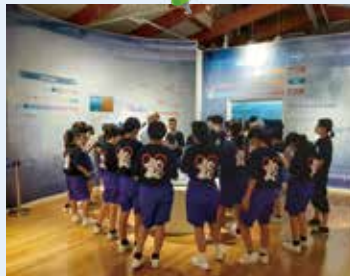
熱心に説明を聞く、角館中学校の生徒の皆さん。

これまで田沢湖クニマス未来館には延べ85,000人（令和4年3月末）のお客さまに来館をいただいております。学校や子ども関係の団体が年々増加傾向にあります。近年は新型コロナウイルス感染拡大の影響などもありましたが、今年のゴールデンウィーク期間は昨年の1.5倍の来館者数となり、県外の中学校の修学旅行などの団体予約も増加していることから、今年度末頃には来館者10万人の記念セレモニーの開催を予定しています。