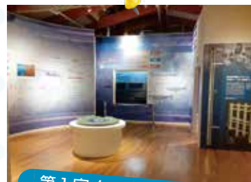
第1室 クニマス大水槽