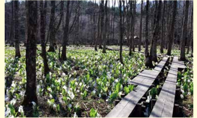
比較的穏やかな日が続き、2回目の撮影に訪れた4月17日には見頃を迎えていました。

新型コロナウイルス感染症の影響により中止となった「刺巻水ばしょう祭り」。イベントや出店は行われませんでした。刺巻湿原の水ばしょうは、4月に入ると咲きはじめ、いつもと変わらない純白の美しさを私たちにを見せてくれました。