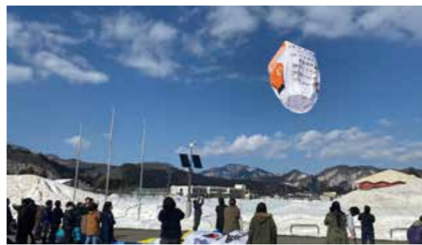
今年3月、松木内小・中学校で行われた紙風船上げ。

仙北市教育委員会では、地域学校協働活動の取り組みを進めています。これは、地域の方々や学校がパートナーとなり、子どもたちの学びや体験を充実させるとともに、元気な地域づくりを進めていこうというものです。この取り組みの要となるのが地域と学校の架け橋役を担う「地域学校協働活動推進員」です。推進員の働きかけによって学校は多様な地域人材とつながることができるようになり、今後も活動を長く続けていくことが容易になります。