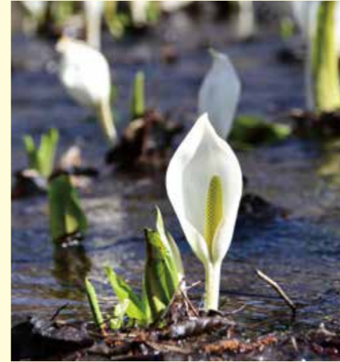
青空の下、水ばしょうの純白が映えます。(4月9日撮影)