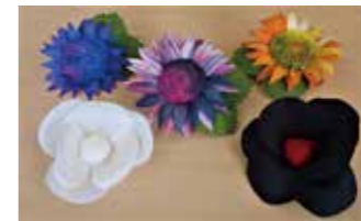
2種の花をコーディネートした制作品!

花をコーディネートした可愛らしいブローチを作ってみませんか。 ご自身の服やバッグに付けて楽しんで、プレゼントにもいいですね。