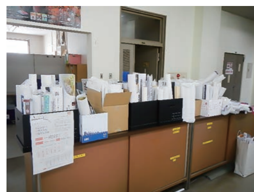
ご協力ありがとうございました。

カレンダー・リサイクル・プロジェクトのお礼 【問合せ】企画政策課(田沢湖庁舎) ☎ (43) 11112 1月4日から2月15日まで、田沢湖、角館および西木の各庁舎で、利用されていないカレンダーの有効活用を目的に行ったものです。集まったカレンダーのうち、約350本を「子どもたちの絵かき用」として、市内の多くのこども園を運営する「はなさき仙北」に寄贈させていただきました。市民の皆さまのご理解とご協力に感謝申し上げます。 残りのカレンダー約50本は、3月末まで角館庁舎1階市民センター前に置いてありますので、ご自由にご利用ください。