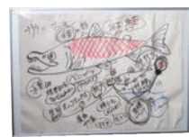
階段の壁に6枚掲示されています。