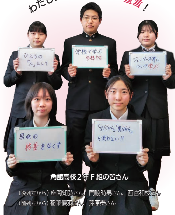
角館高校2年F組の皆さん