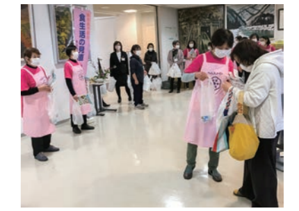
一人ひとり手渡ししながら呼びかけました。