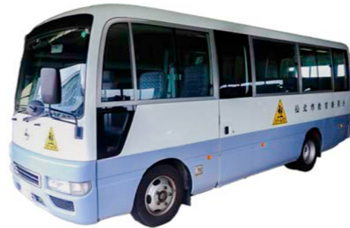
日産自動車/シビリアン (PDG-EHW41)