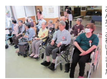
みなさんでお祝いました。

9月16日に「にしき園敬老を祝う会」が開催されました。 今年度に傘寿(80歳)を迎えられた4人の方が市からお祝い金をいただきました。ほかに、古希(70歳)1人、喜寿(77歳)2人、米寿(88歳)3人、卒寿(90歳)7人と、節目を迎えられた方々がいます。 皆さま方が昭和の激動の時代を乗り越え、ご自分たちの手で人生を切り開いてこれ、今の時代が築かれてきました。 また寒い季節になりますがいつまでもお元気で、ますます長寿を重ねられますことをにしき園職員一同ご祈念申し上げます。