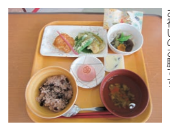
お祝いのお膳です。