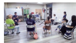
生伴奏で本格的な練習です。

9月開催の生保内節全国大会に受講者の多くが出演していましたが、新型コロナウイルス感染症の影響により、2年連続で中止となりました。それでも皆さんは「生演奏をバックに唄える練習はとても楽しく貴重な体験になった!」と来年、大会が開催されたら必ず出場したいと話してくれました。