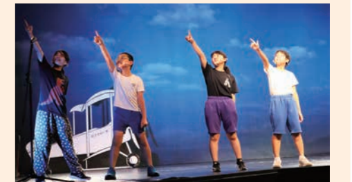
役にたりきって演じる子どもたち。