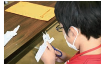
手際よく切り取っていきます。