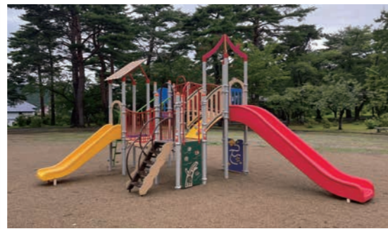
ぜひ生保内公園で遊んでみてください。

生保内公園にコンビネーション遊具が完成しました。幼児向け、児童向けのすべり台にアスレチック的な遊びを装備。回遊しやすいレイアウトの遊具です。皆さん、たくさん使って遊んでね！