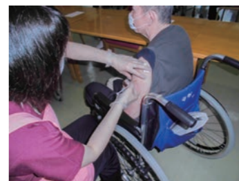
順調に接種が終わりました。

仙北市の新型コロナウイルス感染症のワクチン接種が始まり、現在は65歳未満の市民の方々にも接種券が配付されてきています。にしき園では、高齢者施設として、ご利用者さまと職員のおおむね全員が園内で、7月8日をもって第2回目の接種を終えることができました。