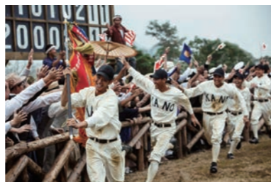
「KANO 1931 海の向こうの甲子園」

台湾祭の目玉は「KANO 1931 海の向こうの甲子園」という映画の上映会です。この映画は、2018年の金農旋風のおかげで知っていた秋田の方も多いかと思います。興味はあるけど、まだ見たことがない！という方がいれば、ぜひこの機会にご覧ください！映画のほかにも、台湾写真展、温泉提携関連資料展示、台湾雑貨・図書販売などを予定しています。