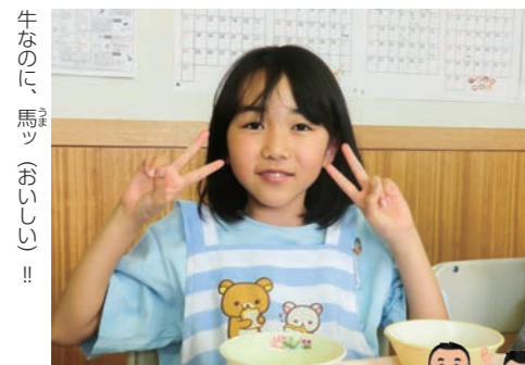
牛なのに、馬ッ(おいしい)!!

今回のメニューは牛丼です。いつもの牛丼と比べてひと味もふた味も違います。なぜなら高級食材「秋田牛」を使った牛丼だからです。 松木内小学校から、そのおいしさを大喜利でお伝えします。