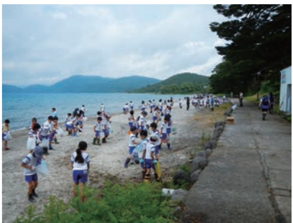
クリーンアップの様子。

ざっくばらんの会では白浜の鳴砂復活を目指し、「白浜クリーンアップ大作戦」を行います。皆さまお誘い合わせのうえ、ぜひご参加ください。 【日時】 7月11日 9:30～11:30（小雨決行） 【場所】 9:20まで春山イベント広場（田沢湖マラソン特設会場）に集合 【持ち物】 軍手、くま手 【問合せ】 ▶ざっくばらんの会 田口 ☎090-4049-9502 ▶仙北市企画政策課 ☎43-1112