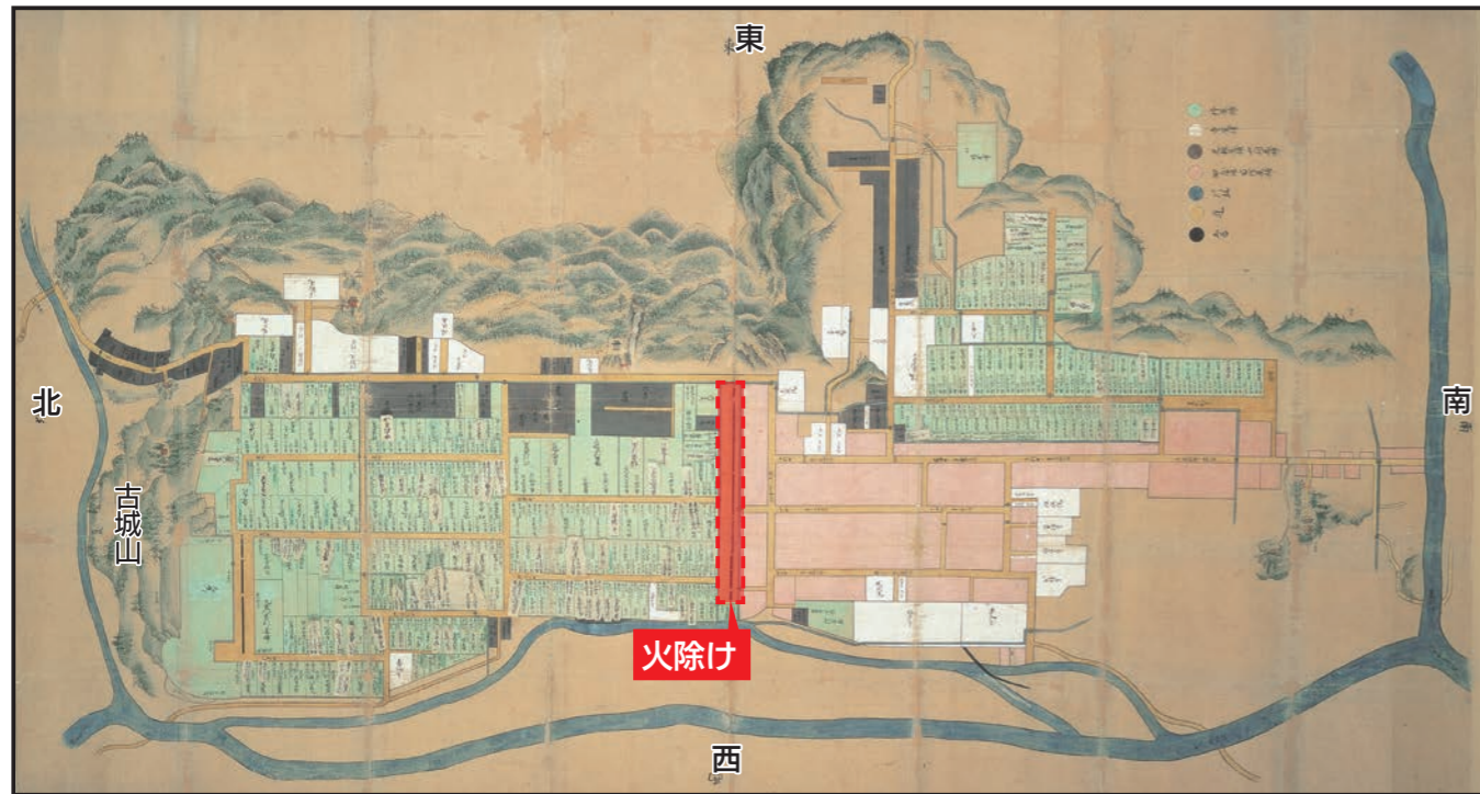
角館「町割絵図」【享保年間(1716年～1736年)】／赤色の点線で囲まれた範囲が“火除け”

60年もの間、市民の皆さまに親しまれてきました旧角館庁舎が、その役割を終えて解体されることになりました。 この庁舎は、約400年前の江戸時代に造られた、延焼防止機能と防衛機能、そして武家町と町人町との境界機能をあわせもつ「火除け」と呼ばれる帯状の遺構の跡地に建てられています。 現在、仙北市では市のシンボルとなり得る「火除け」の復元を目指しています。そこで、市民の皆さまから広く「火除け」に関する情報を募ることにしました。 なお、東西方向に高さ1丈(約3メートル)もの土塁(土手のようなもの)があったとの記録も残っています。文字資料や写真(絵はがき)などの情報をお持ちの方は、次の連絡先までご一報ください。お待ちしております。 ● 連絡先／文化財保護室 住所／〒014-0392 角館町中菅沢81-8(角館庁舎2階) 電話／43-3384 FAX／54-4102 電子メール／kybunka@city.semboku.akita.jp