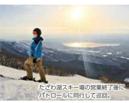
たざわ湖スキー場の営業終了後にパトロールに同行して巡回。