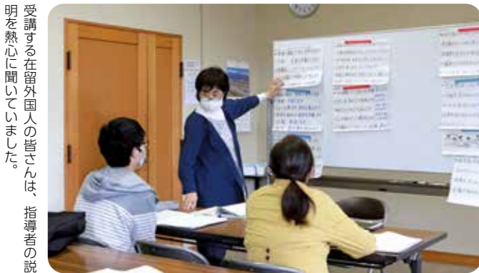
受講する在留外国人の皆さんは、指導者の説明を熱心に聞いていました。