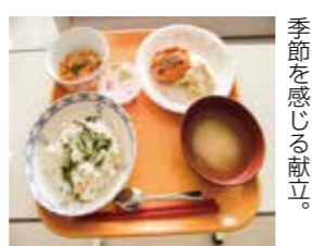
季節を感じる献立。

4月6日の昼食には、山菜の王様ともいわれるたらの芽を混ぜ込んだ「たらの芽ごはん」が提供されました。香りと風味がよく、好評でした。今後も、こごみ・わらび・ミズなどを提供していく予定です。食事からも季節を感じてもらえたらと思います。