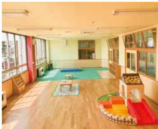
ぜひ、お子さんと一緒にお越しください。