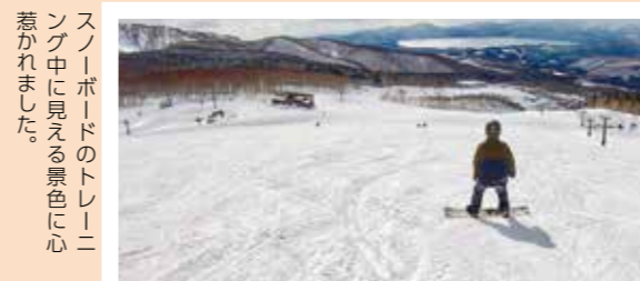
スノーボードのトレーニング中に見える景色に心惹かれました。

私の主な活動は「田沢湖自然体験センター」や「たざわ湖スキー場」などと連携し、田沢湖やその周辺、十和田八幡平国立公園などの外国人向けのガイド、インスタクター、情報発信業務です。 ガイドを行う季節により活動場所が変わるのですが、春から秋には「田沢湖自然体験センター」で、カヤック、シャワークライミングやラフティングなどのガイドと、そのアシストをしています。冬にも「たざわ湖スキー場」で同様の活動をするために、