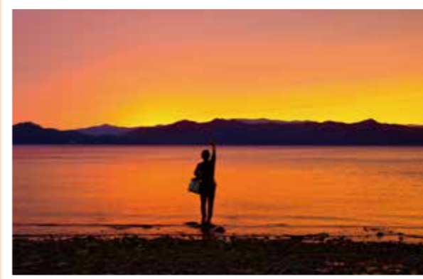
美しい秋の絶景スポット。

都会では自分の時間や空間を持つことが難しいです。暮らす家は比較的小さい部屋であり、外遊びの時は渋滞や待つことに時間を費やし、駐車スペースと休憩席取りも労力がかかります。なおさら今は感染症対策で悩まされます。田舎と都会はそれぞれメリットがありますが、私は秋田暮らしが大好きです。