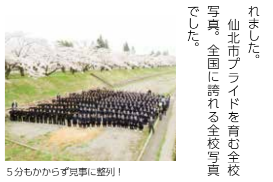
5分もかからず見事に整列!

角館中学校で例年行われている全校写真撮影がこのほど行われました。驚くべきは、松木内川堤の桜をバックに撮影することです。