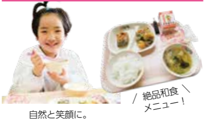
自然と笑顔に。絶品和食メニュー!

給食センターが統合してまる1年。とびきりおいしい給食は、子どもたちの楽しみの一つになっています。そんなお昼の時間に神代小学校3年生の教室に伺いました。