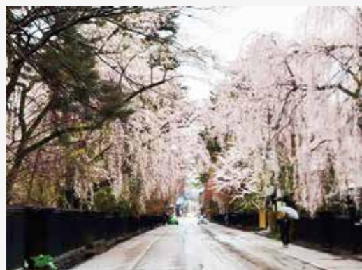
雨でしっとり、武家屋敷通りの枝垂桜。

かくのだてフィルムコミッション (仙北市観光課内) ☎43-3352 https://kakunodate-fc.jp/