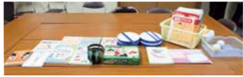
昨年度購入した教材。子どもたちが喜ぶ様々な教材が有効に使われています。