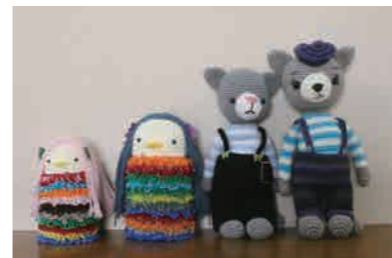
この中から、制作する作品をお選びください。