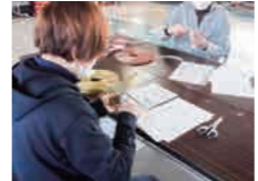
熱心に取り組んでいます。

11月と12月に計4回にわたって、西木公民館では紙ひもを使った初めての方向けのエコクラフト教室を開催しました。エコクラフトにはいろいろな編み方がありますが、今回は四つ畳み編みでバッグを作ること挑戦しました。編み方を教わると自宅でも取り組んでいるようでした。参加者からは「また参加したい」と好評でした。1月からは、経験者向けの教室も開催しています。来年度も同様の教室を開催する予定です。