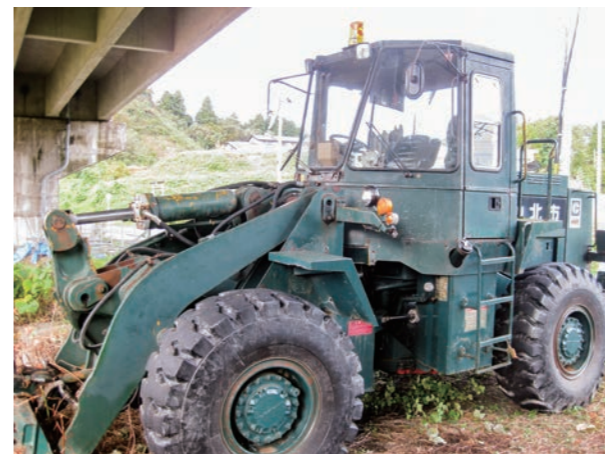
②キャタピラー タイヤドーザー（65 R改）昭和59年車