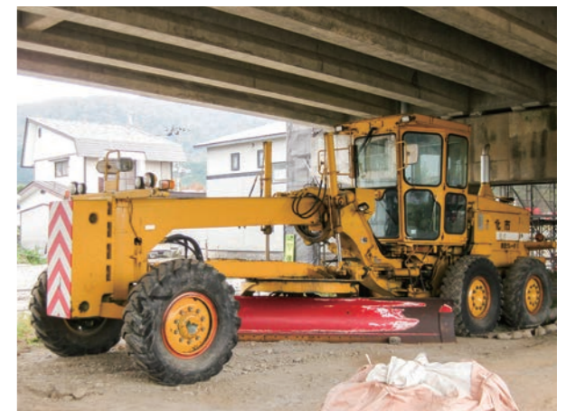
①コマツ グレーダー（GD705A4A）平成4年車