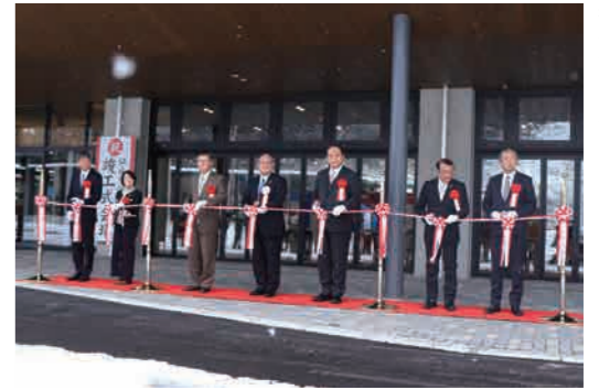
正面入口前で関係者によるテープカットが行われました。

12月21日に仙北市新角館庁舎の竣工を記念して「角館庁舎竣工式」が開催されました。式典には佐竹敬久秋田県知事、御法川信英衆議院議員、加賀屋千鶴子秋田県議会議員など来賓や関係者およそ70人が新角館庁舎の竣工をお祝いしました。始めに竣工式神事が行われ、角館庁舎の無事完成と感謝を報告。雪が少しちらつく中行われたテープカットセレモニーでは、完成を祝い仙北市の未来への出発を祈念して張り渡したテープが切られました。竣工記念式典では門脇光浩市長から「角館庁舎は伝統と先進