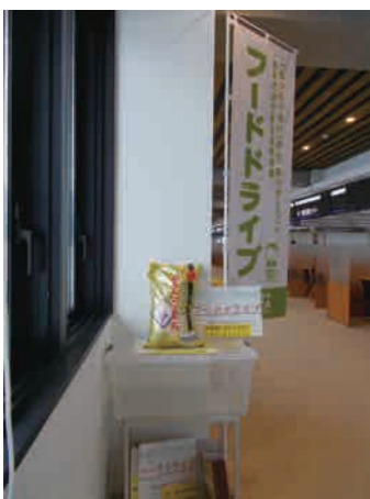
角館庁舎1階の社会福祉課前に「フードドライブ」のコーナーを設置しています。