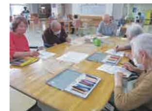
色選びに個性がでます。

●レクリエーション…スプーンリレー、輪投げ、的当て、風船バレーなどをします。チームを組んで協力しながらのゲームです。勝負をかけて、一喜一憂です。