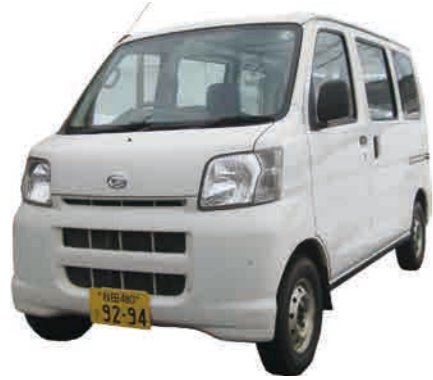
ダイハツハイゼットカーゴ 平成19年式(LF-S330V)