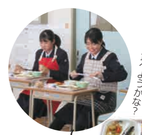
これから食べようかな？

スペシャルメニューは後にとっておく子どもが多かったです。最後はみんな完食でした。おしゃべりは慎ましく、静かに食事を楽しんでいました。草薨