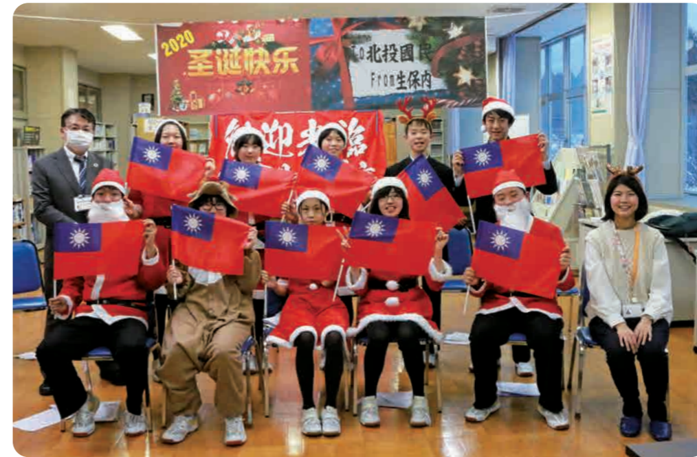
充実したオンライン交流を終え、みんな笑顔です。

まだ多くの時間が必要であり、現時点で新たな取り組みの目途は立っていません。こうした現状などを踏まえ、この度、仙北市と環境活動に取り組む市民団体などが「田沢湖再生ネットワーク」を発足し、市外・県外にも田沢湖に関わる人々を増やすとともに、多様な組織・団体などの連携や協働の取り組みを推進していくことにしました。