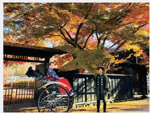
紅葉の武家屋敷での取材風景。