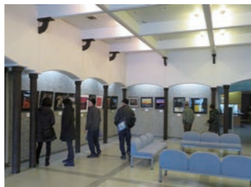
昨年の美術展の様子。